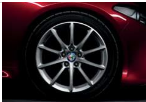
1M7 - jante din aliaj de 17" cu 10 spite