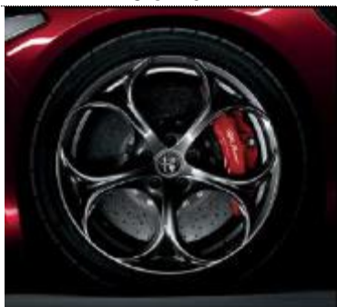
3CX – jante din aliaj de 19" brunate cu 5 orificii