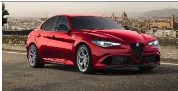
465 – Rosso GTA