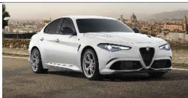
248 – Bianco Trofeo Tristrato