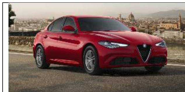
414 – Rosso Alfa Pastello