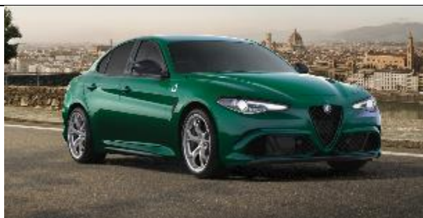
646 – Verde Montreal Tristrato