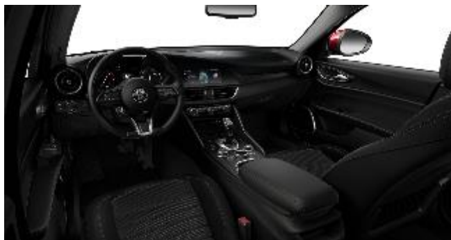
728 – Tessuto Nero 034 – Tessuto Nero /grigio