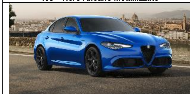
756 – Blu Misano Metallizzato