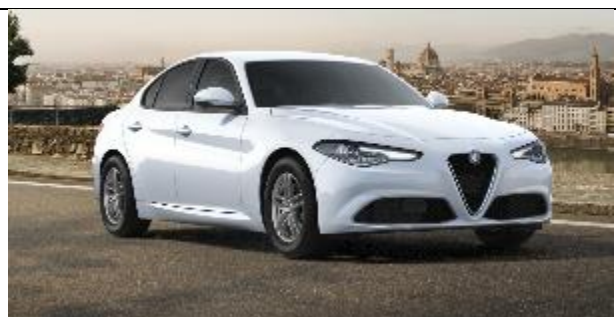
217 – BiancoAlfa Pastello