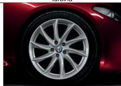
3CO - jante din aliaj de 18" cu design turbina