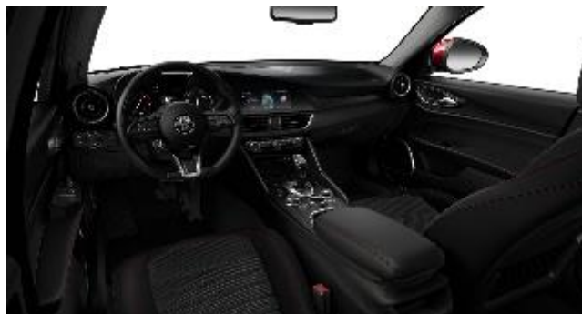
035 – Tessuto Nero/rosso