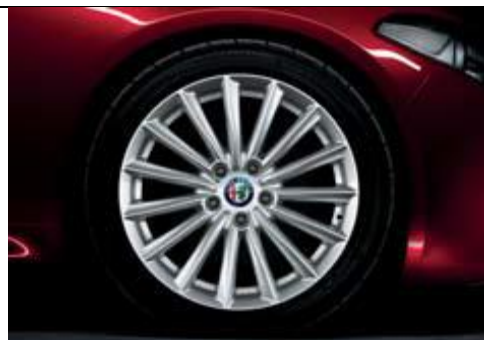
1MH - jante din aliaj de 17" cu design turbina