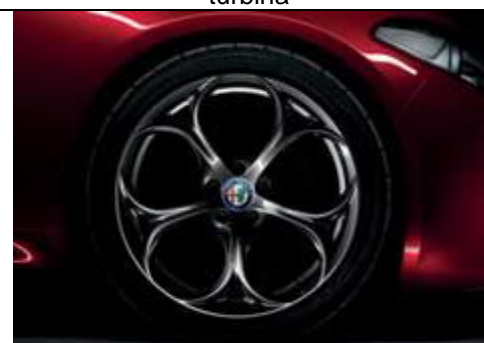
3CV – jante din aliaj de 19" brunate cu 5 orificii