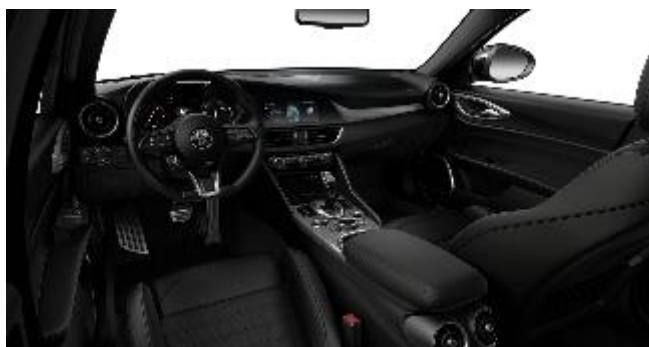
473 – Piele neagra 474 – Piele neagra cu cusatura rosie