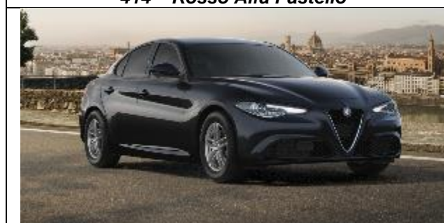
408 – Nero Vulcano Metallizzato