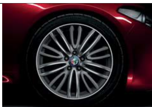
1MP - jante din aliaj de 18" cu 10 spite duble