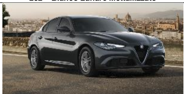
035 – Grigio Vesuvio Metallizzato