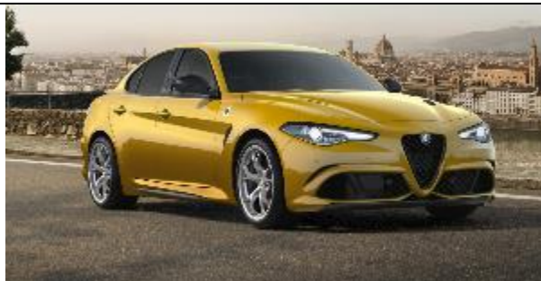
437 – Junior GT Ocra